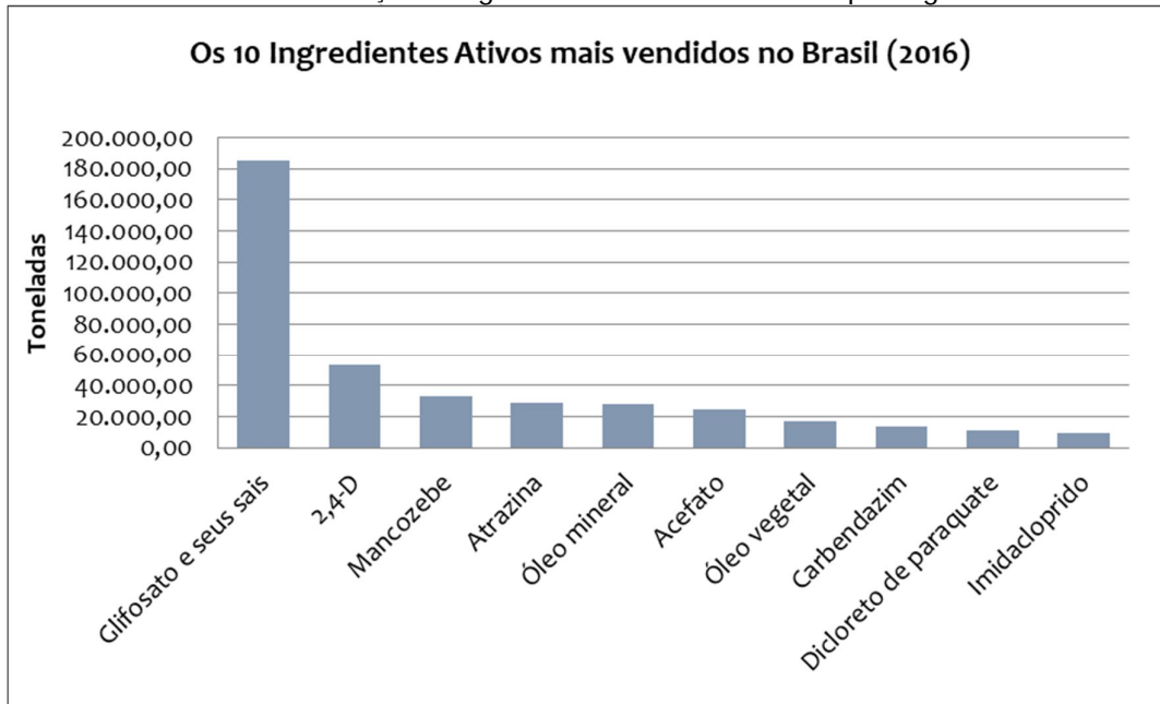
Gráfico 1 – A comercialização de agrotóxicos em 2016 no Brasil por Ingrediente Ativo.