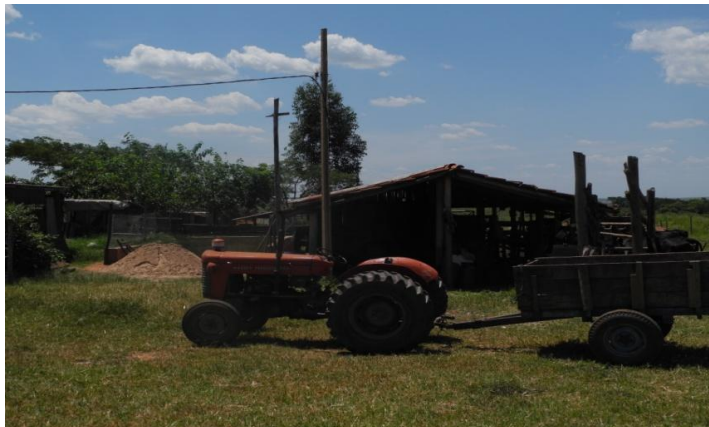
Figura 5 - Instalações e equipamentos para produção agrícola, Assentamento Loiva Lurdes, Municípios de Agudos e Borebi, Estado de São Paulo, 2015

Fonte: Dados de pesquisa Foto de Andre Luiz de Souza