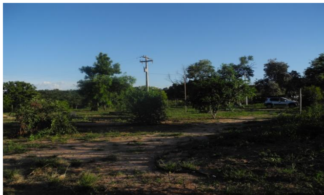
Figura 1 – Vista Geral do Assentamento Loiva Lurdes, Municípios de Agudos e Borebi, Estado de São Paulo, 2015

Fonte: Dados de pesquisa Foto de Andre Luiz de Souza