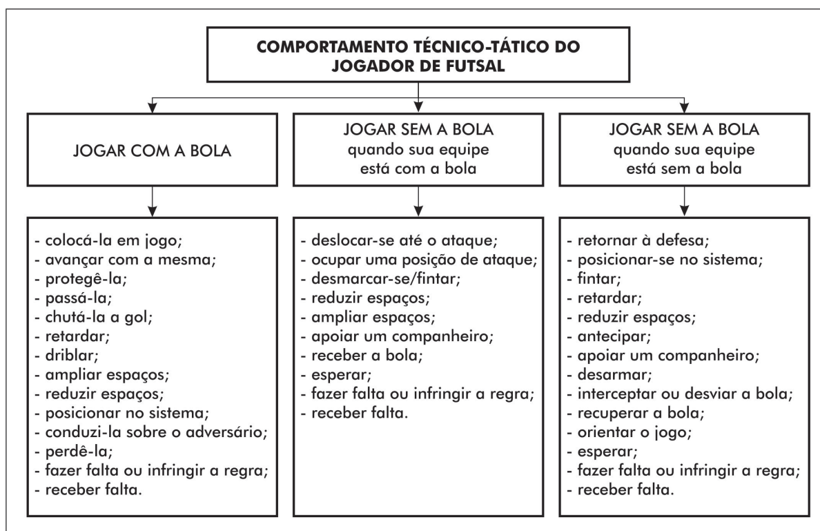
Figura 3 - Comportamento técnico-tático do jogador (MORENO, 1999 apud SANTANA 2008).

Devido à natureza dos Jogos Esportivos Coletivos, tanto os sistemas de defesa quanto os de ataque, se ajustam ao longo do jogo em função do comportamento do adversário (LAMES, 2006;