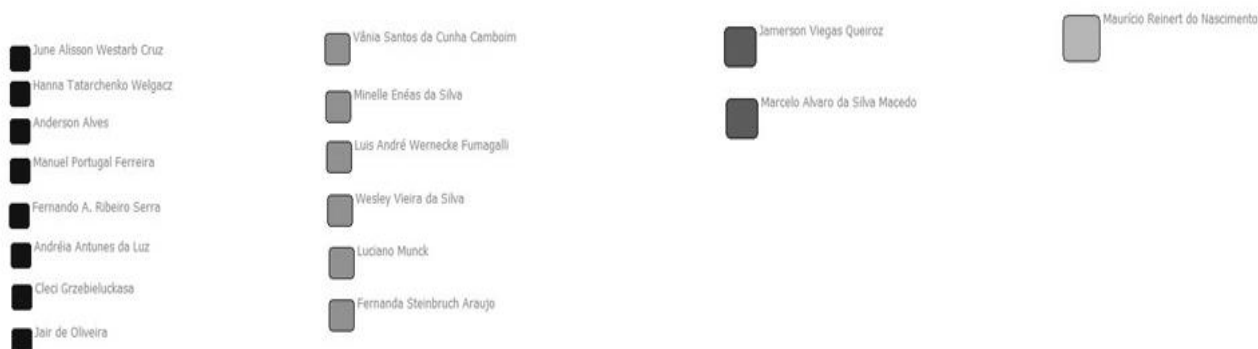
Figura 3 - Principais autores por centralidade

A Figura 3 apresenta os principais autores por centralidade.