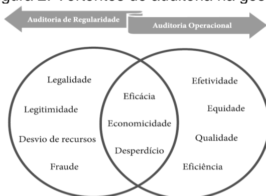
Figura 2: Vertentes de auditoria na gestão pública.