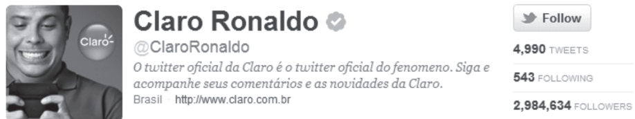
Figura 04 – Apresentação e dados do Twitter @Claroronaldo.

Na análise foram definidas unidades de conteúdo que permitiram traçar links entre as mensagens veiculadas nas pages das marcas em questão. Para definição dessas unidades de conteúdo foram analisados os tweets do perfil @Claroronaldo, o perfil foi escolhido por ser o perfil de empresa mais seguido do Twitter .