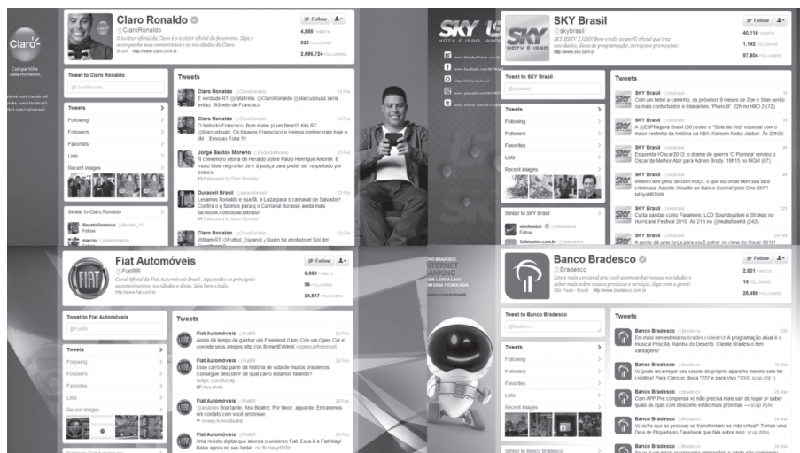
Figura 03 – Home Page das marcas no Twitter .

Para aferir a quantidade dessas menções usou-se a ferramenta de pesquisa avançada do Twitter . Procurou-se ainda observar quais dessas mensagens tiveram destaque em outras redes e sites ou mesmo nos trendtopics do microblogging Twitter .