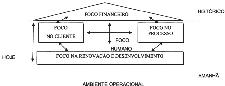
Figura 1 - Modelo Navegador Skandia

A Figura 1 apresenta o os focos mensurados no Navegador Skandia.