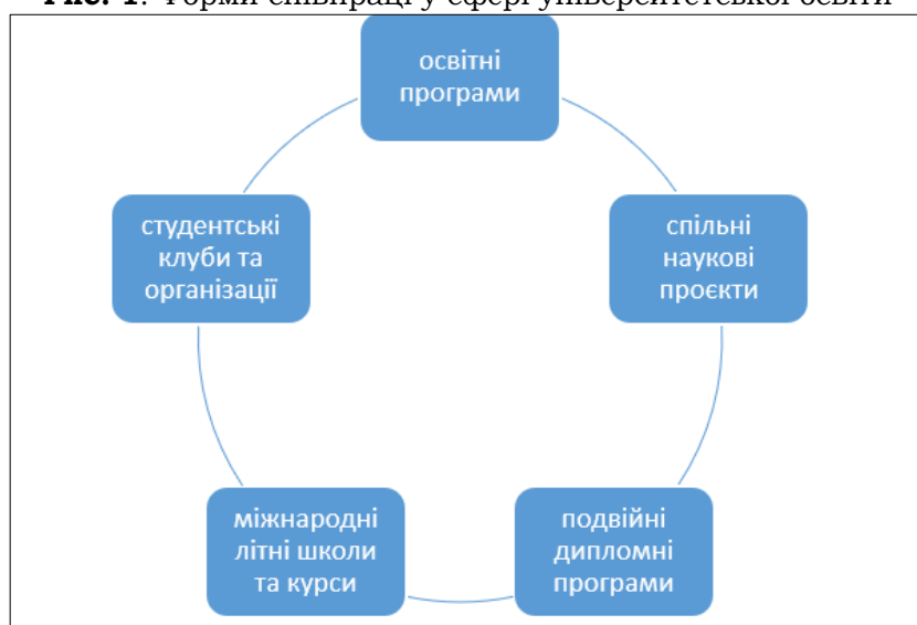
Рис. 1: Форми співпраці у сфері університетської освіти

1. Програма Erasmus+. Одна з найбільш популярних програм обміну студентами та викладачами між університетами Європейського Союзу, включаючи Україну та Польщу. Програма надає можливості для короткострокового та довгострокового обміну студентів, викладачів та іншого персоналу.