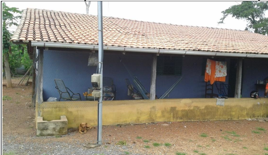
Imagem 4 - Casa Construída pelo CESTE com Área Externa Acrescentada pelo Dono.

O que o camponês descreve é o processo de estranhamento promovido pela infraestrutura econômica. De fato, “O mundo capitalista no qual vivemos, sugere que o capital é mais importante que os indivíduos. As hidrelétricas são mais uma maneira que se tem de acumulação de capital” (SANTOS; SIEBEN, 2014, p. 7). Inicialmente, as condições de vida eram precárias, mesmo sendo o assentamento Mirindiba o de maior potencial dentre os demais. A primeira dificuldade observada foi a péssima estrutura das moradias, que necessitavam urgentemente de adequações (Imagem 4). Todas as modificações realizadas pelas famílias foram custeadas por elas próprias.