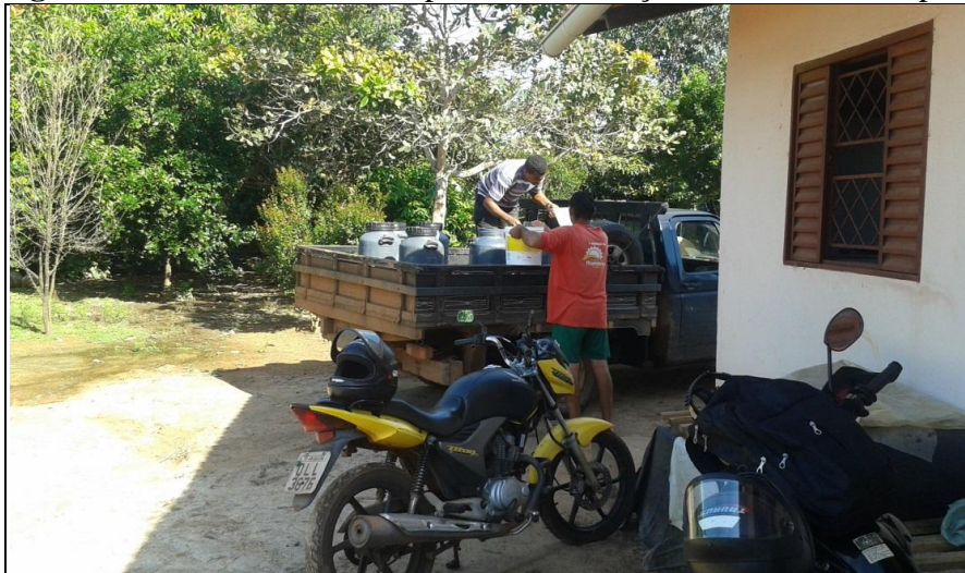
Imagem 11 - Atravessador Comprando a Produção Leiteira de Camponês.