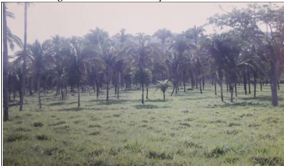
Imagem 2 - Floresta de Babaçu na Ilha de São José.

A vegetação era típica de Cerrado, com variações do tipo Mata de cocais. O Babaçu, palmácea endêmica da região (Imagem 2), representava a espécie mais significativa (Babaçual). As mulheres camponesas desenvolviam constantemente atividades econômicas em torno desse vegetal. Assim, as Quebradeiras de Cocos , como são conhecidas, processavam o fruto e dele retiravam uma variedade de produtos derivados, a saber, o leite, o azeite, o sabão, além do carvão feito da casca refugada após a retirada da castanha. Era desconhecida por parte dos moradores a utilização de vegetal que não fosse originário do coco Babaçu.