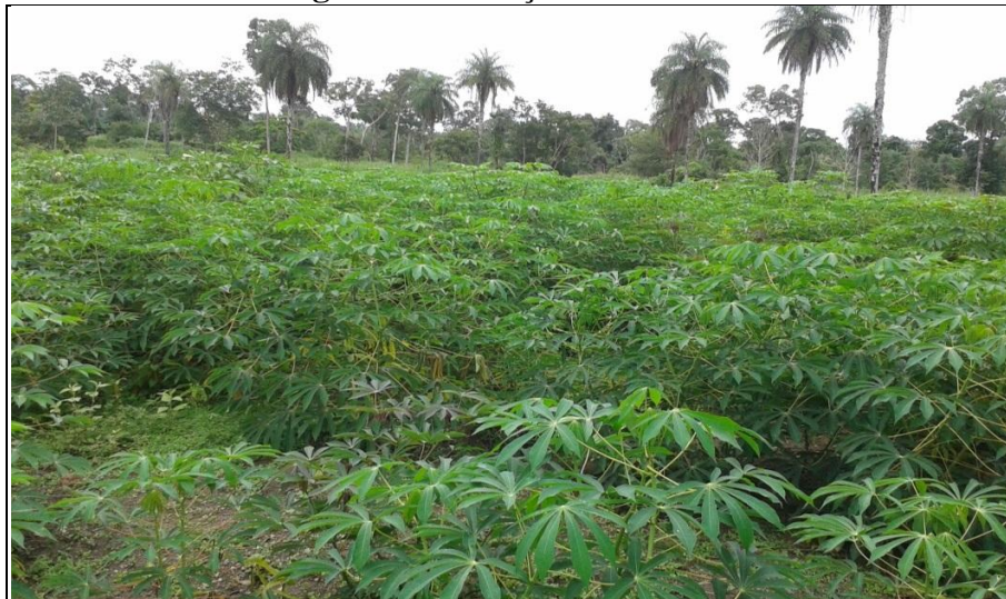
Imagem 7 - Plantação de Mandioca.

maracujá, a abóbora, a melancia, a pimenta, a cebola e o coentro são observados com frequência. Entre os animais criados nas propriedades destacam-se os bovinos, as galinhas e os porcos. A policultura não é abandonada, por mais que o mercado pressione as famílias. Um camponês relatou que a prática da pecuária bovina lhe poupa os gastos com adubo, já que os dejetos do rebanho são utilizados como fertilizante natural.