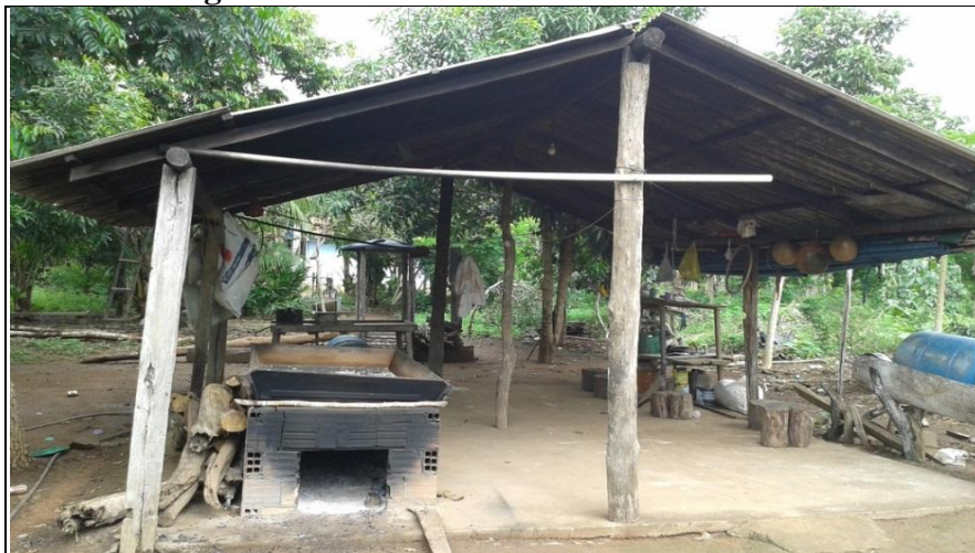
Imagem 10 - Casa de Fazer Farinha de Mandioca

A mandioca assume a vanguarda da produção, sendo bastante aceita no mercado de Araguaína, além de constituir a matéria-prima de outras mercadorias. Depois de ultrapassado os limites do consumo doméstico, esse artigo passa a ser comercializada pelos camponeses. A manufatura da mandioca, por outro lado, consiste, principalmente, na produção de farinha, alicerçada no regime de mutirão. Nesse sistema de cooperação, a casa de fazer farinha (Imagem 10) é utilizada de forma coletiva por membros de duas ou mais famílias. A matéria-prima, mandioca, se origina da lavoura daqueles que estão envolvidos. Ao término do processo ocorre a divisão da produção.