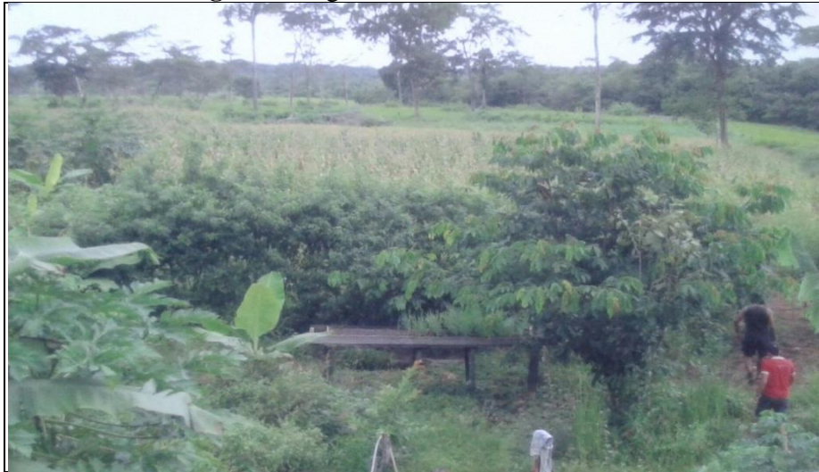
Imagem 1 - Agricultura na Ilha de São José.