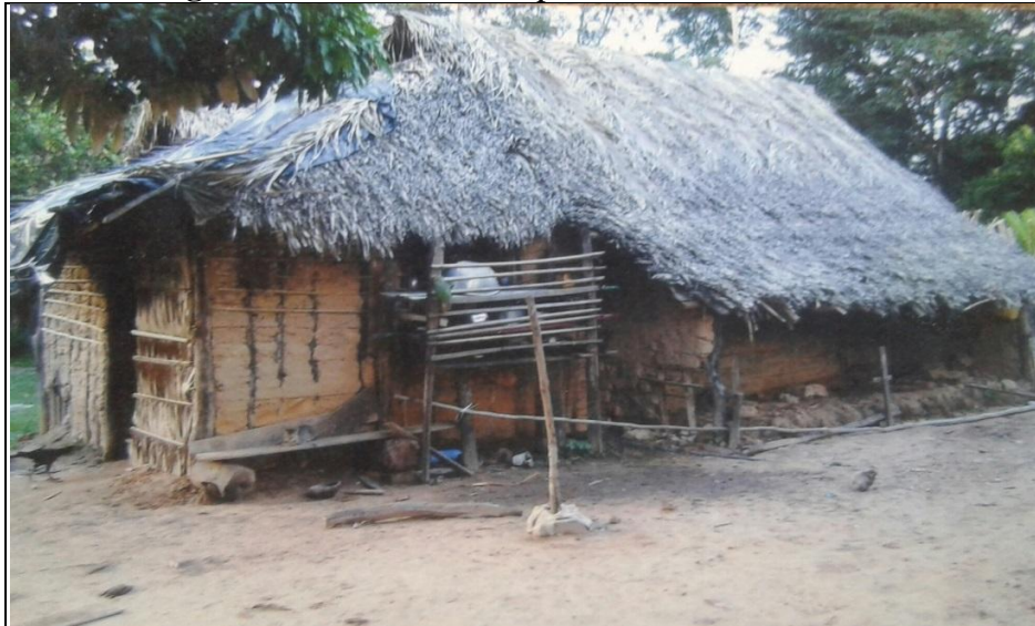
Imagem 3 - Residência Camponesa na Ilha de São José.