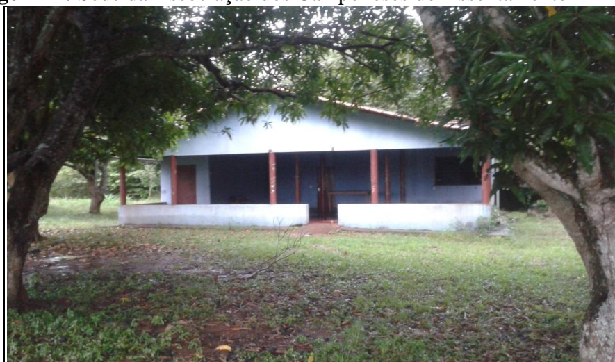
Imagem 12: Sede da Associação dos Camponeses do Assentamento Mirindiba.

Como tentativa de luta contra essas amarras do capital, o campesinato remanescente da Ilha de São José se organizou através da criação de uma associação. O galpão da associação (Imagem 12) é utilizado frequentemente para as reuniões dos assentados, e também para os encontros com os representantes do CESTE. Após os primeiros anos de baixa produtividade no assentamento, a associação teve um papel crucial na vida dos camponeses, pois de forma coletiva as famílias firmaram um convênio com a Companhia Nacional de Abastecimento (CONAB), ganhando o direito de participar como fornecedores do Programa de Aquisição de Alimentos (PAA), administrado pelo órgão.