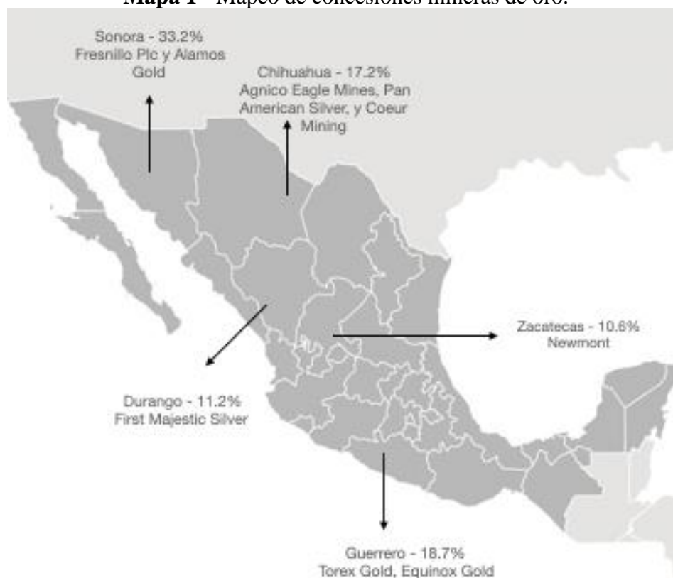
Mapa 1 - Mapeo de concesiones mineras de oro.