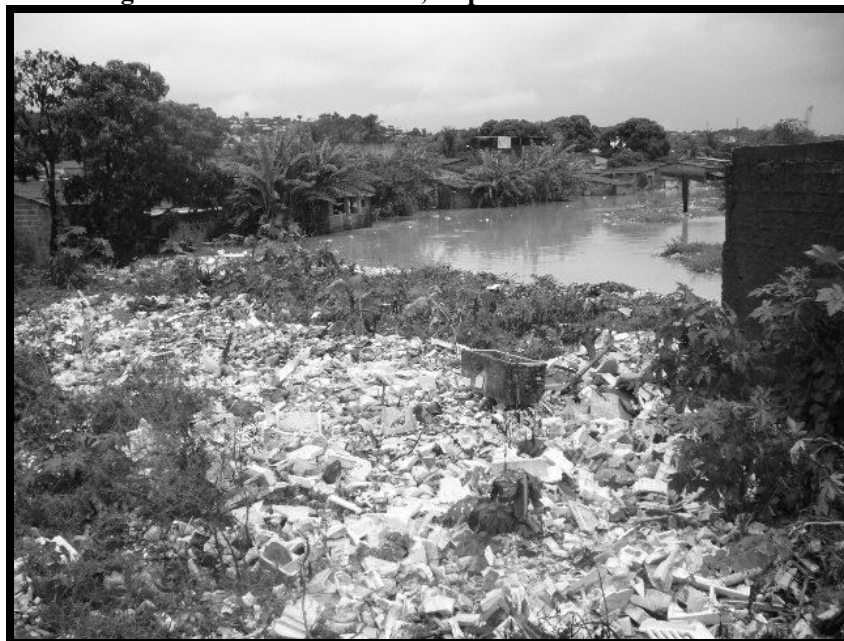
Figura 2 – Resíduos Sólidos, Impactando o Rio Beberibe.

Como consequência, observa-se a ocupação às margens dos rios, onde a população ribeirinha acaba contribuindo ainda mais para o aumento da poluição por meio da falta de tratamento sanitário e dos resíduos sólidos lançados diretamente no curso d'água, como se observa na Figura 2. Neste caso, a quem deve ser atribuída a principal causa da degradação ambiental? Ao Estado, por não cumprir com seu papel de garantir os direitos básicos para a população, ou ao aumento populacional, remetendo a uma idéia “Malthusiana”, talvez pessimista, do crescimento em progressões geométricas enquanto a produção de bens essenciais cresce em progressão aritmética?