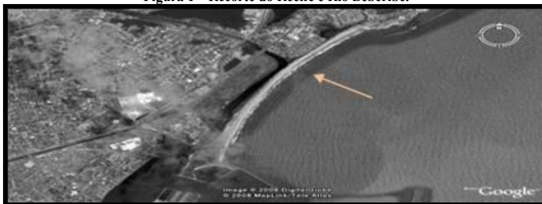
Figura 1 – Recorte do Recife e Rio Beberibe.

O fato faz parte do processo cultural brasileiro, quando se pode ter leitura do sistema fluvial do rio Beberibe (Figura 1) na cidade do Recife-PE, entre as coordenadas latitudinais de 7° 41' 09 e 8° 35' 22" S e coordenadas longitudinais 34° 48' 47 e 35° 16' 09" W.