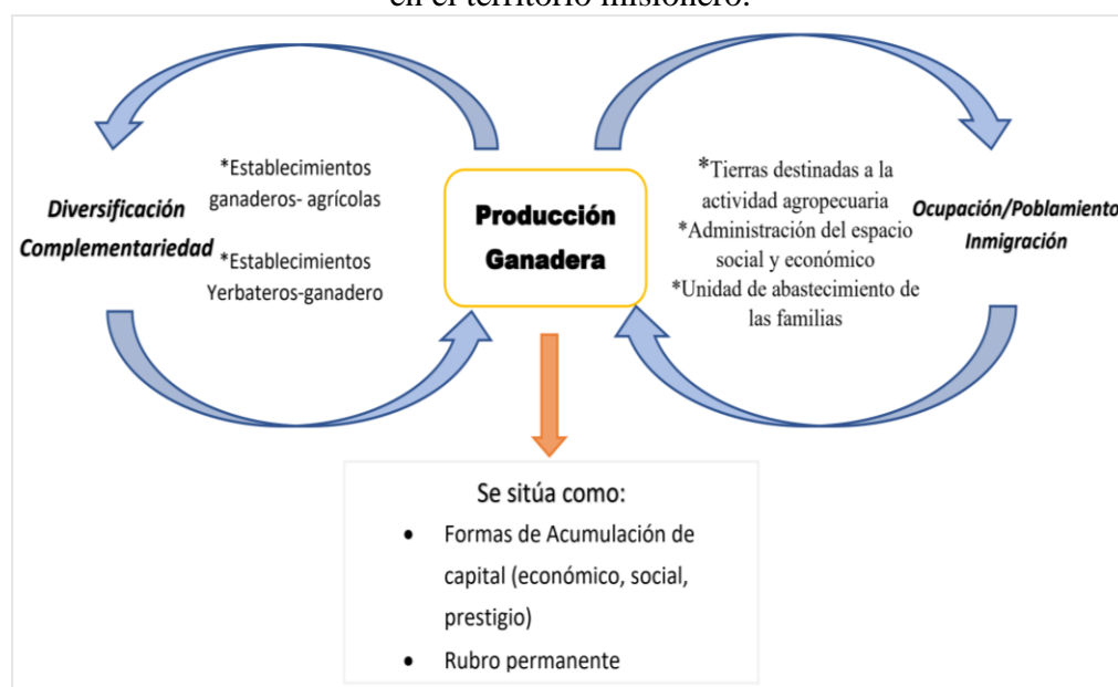
Figura 02 - Relación entre la producción ganadera, la ocupación y diversificación económica en el territorio misionero.

Los factores combinados de disponibilidad de tierras, la multiplicación de las actividades económicas y las oportunidades de inserción laboral definieron la orientación de la expansión territorial, atrayendo a migrantes (fronterizos y criollos) e inmigrantes (de otras nacionalidades) a asentarse en el territorio, convertirse en propietarios de tierras, acumular capital y posicionarse en la sociedad local (Zorrilla, 2023). Es así que, afirmamos que la producción ganadera en un contexto de diversificación económica y de movilidad poblacional constante, se mantuvo de manera independiente como actividad productiva, pero al mismo tiempo se re-posiciona como producto complementario a otras actividades, como la agrícola, posibilitando el surgimiento de establecimientos ganadero-yerbatero y agrícola-ganadero que combinan ambas actividades (Figura 02).