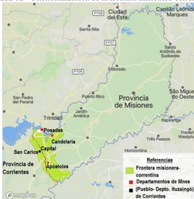
Figura 01 - Territorialización de la frontera misionera-correntina