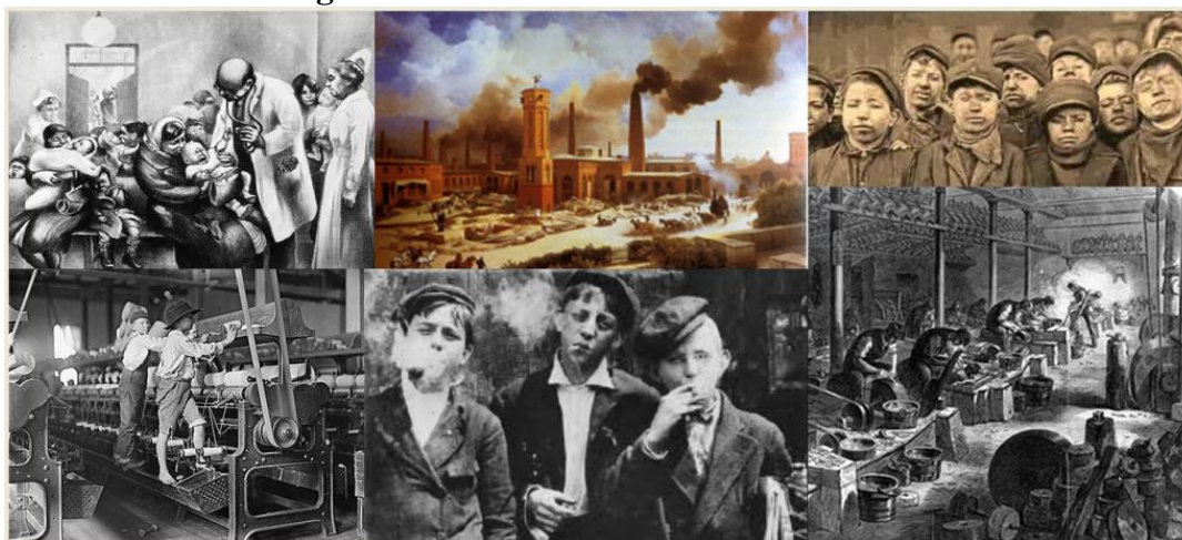
Figura 1: Revolución Industrial