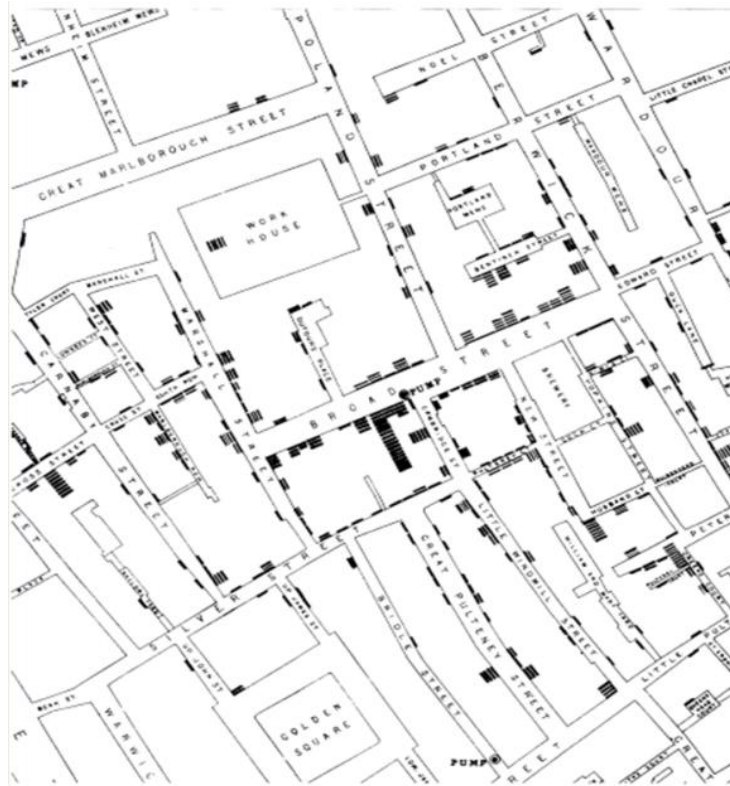
Figura 2: Mapa de puntos de las defunciones provocadas por el cólera en Londres, 1854

Snow, demostró que el cólera era causado por el consumo de aguas contaminadas con materias fecales, al comprobar que los casos de esta enfermedad se agrupaban en las zonas donde el agua consumida estaba contaminada con heces, en la ciudad de Londres en el año de 1854. Ese año cartografió en un plano del distrito de Soho los pozos de agua, localizando como culpable el existente en Broad Street, en pleno corazón de la epidemia. Luego, a la luz de lo observado en el mapa, recomendó a la comunidad clausurar las bombas de agua, de donde era obtenida para beber [Snow, 1849] (Ver Figura 2).