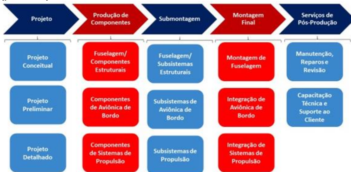
Figura 2 – Mapa da Cadeia Global de Valor da Indústria de Aeronaves