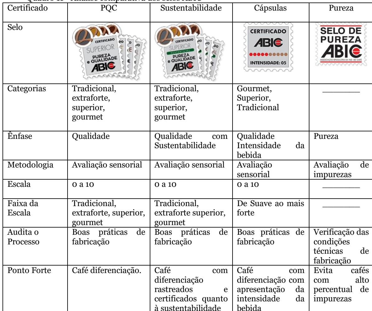
Quadro 11 - Análise comparativa dos selos ABIC

O Quadro 11 apresenta análise comparativa dos selos ABIC. O selo de pureza foi criado para evitar impurezas no café. Mas, com o passar do tempo passou a traduzir qualidade, influenciando no aumento do número de empresas ao programa. O selo PQC além de representar qualidade, consolidou a diferenciação por meio da segmentação dos cafés. O selo de sustentabilidade permite café com diferenciação rastreados e certificados quanto à sustentabilidade. O selo de café em cápsulas possibilita a diferenciação com apresentação da intensidade da bebida.