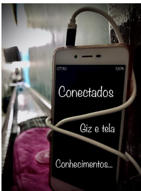
Figura 2: foto-haikai produzido em sala de aula

Fonte: texto elaborado por uma aluna da 3ª série do Ensino Médio.