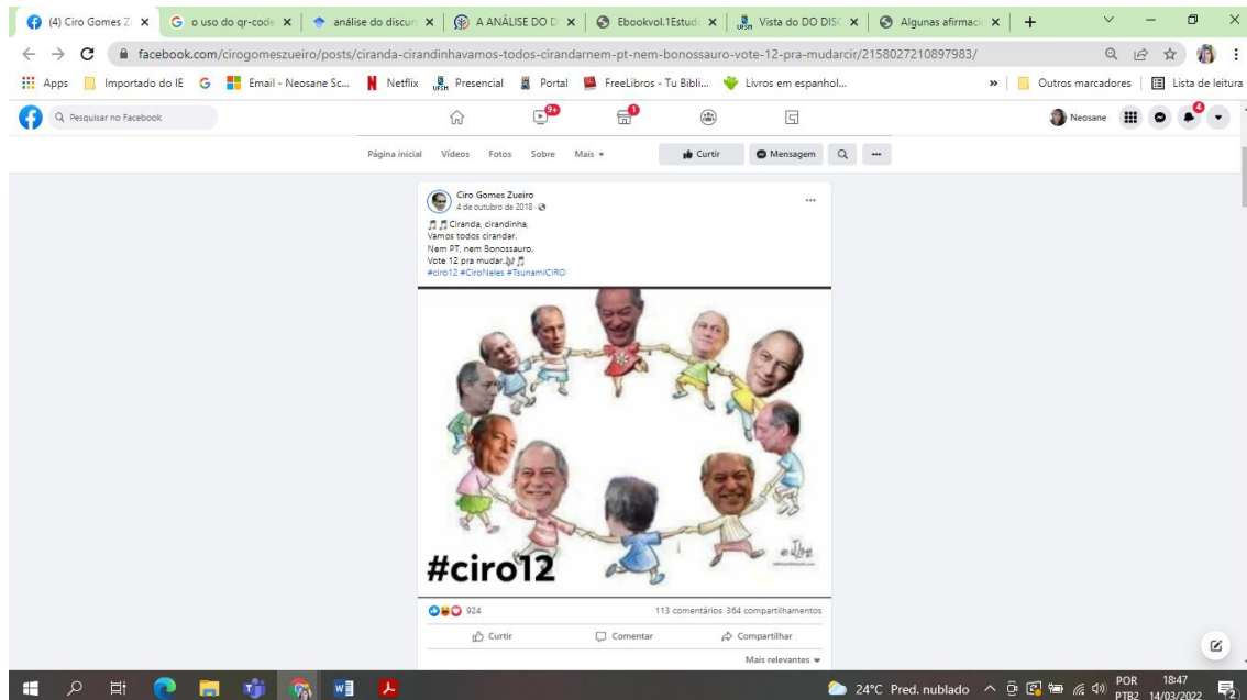
Imagem 3 - Postagem que passou a circular no Facebook, referente à página Ciro Gomes Zueiro .