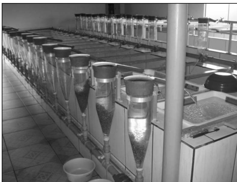
FIGURA 3 - Incubadoras utilizadas no laboratório da Piscicultura Sgarbi, durante a safra 2011/2012.

A tendência temporal com maior produtividade da coleta de ovos na boca das fêmeas foi observada no início da safra, enquanto que, no final desta, a produtividade foi favorecida pela coleta de cardumes de pós-larvas nas hapas de reprodução (WILD, 2013). Estas variações no número de pós-larvas produzidas pode ser atribuída a diversos fatores, como, a estratégia de reprodução empregada,