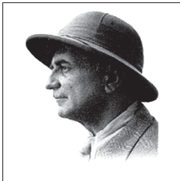
Gilberto Freyre (1900-1987)