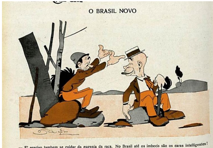
Imagem 2: Careta , 21 de março de 1931, Ano XXIV, nº 1.187.

E teremos o tipo étnico! O tipo standard! O almejado tipo padrão! 7