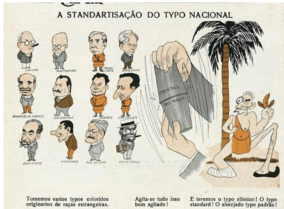
Imagem 1: Careta , 4 de abril de 1931, Ano XXIV, nº 1.189.

Estas considerações também foram motivos da nossa investigação, tanto no que diz respeito ao caráter heterogêneo assumido por esse conceito no Brasil quanto sua discussão enquanto ciência distanciando-a de uma interpretação superficial de "pseudociência". Acreditamos que nossas fontes trazem uma contribuição para a historiografia da eugenia, pois as caricaturas e crônicas da Careta corroboram por meio de seus intelectuais para o ensejo dessa discussão. Passemos agora ao exame de algumas das caricaturas.