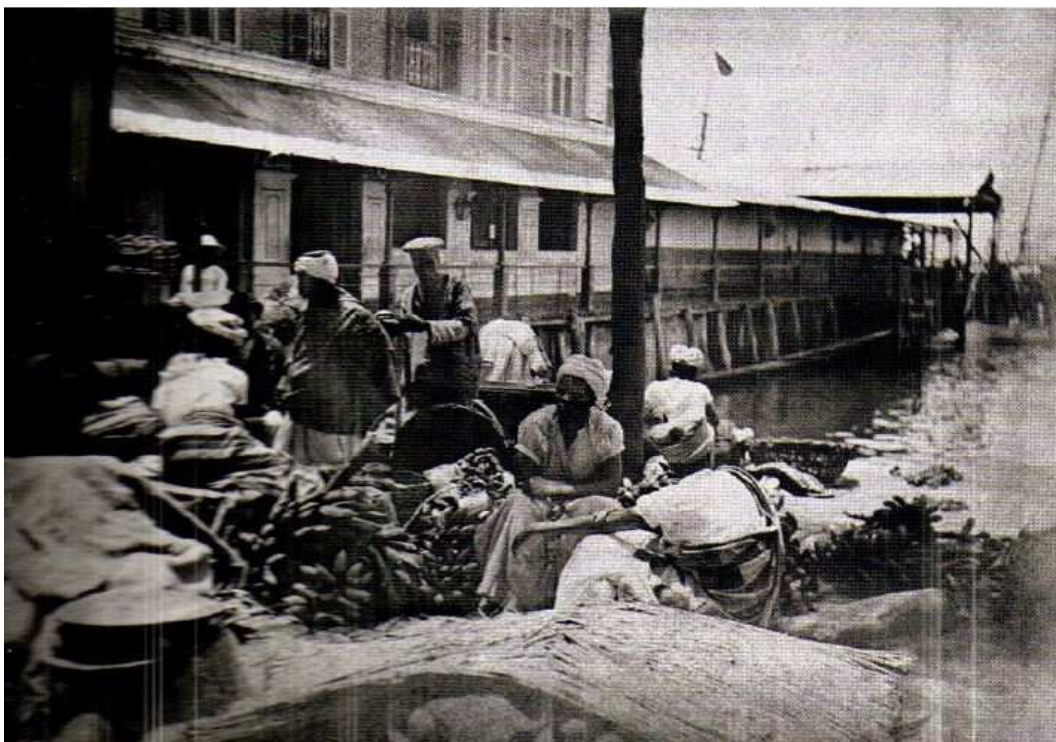
Figura 1: Marc Ferrez. Mercado da Praça do Cais. 1875.

A Praça das Marinhas constituía um dos dois pavilhões virados para o mar que eram anexos à Praça da Candelária, juntamente ao Mercado. Ali desembarcavam os gêneros da roça e o pescado que cativos, pescadores e pequenos lavradores traziam das zonas suburbanas do Rio de Janeiro e das áreas rurais de Niterói, como ilustra a Figura 1: