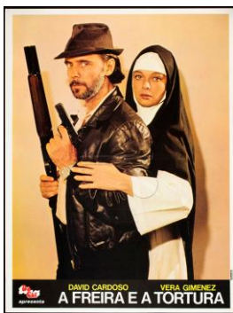
4. O policial torturador (ator David Cardoso) e A freira Joana (atriz Vera Gimenez)

canônico. À acusada foram oferecidas todas as oportunidades de defesa e de arrependimento. Dia após dia, noite após noite, estivemos aqui lutando para arrancar essa pobre alma às garras do Demônio. Mas fomos derrotados. Desgraçadamente. (GOMES, 1985, p. 143).