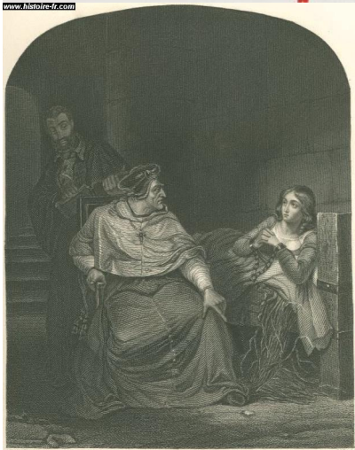
5. Jeanne d'Arc interrogée par Pierre Cauchon, gravure issue de l'ouvrage Cassell's history of England , Angleterre, 1902.

Carvalho (1986), em lição inicial, já alertava sobre a necessidade do estudo literário comparado se vincular às outras dimensões do conhecimento humano dentro do processo investigativo intertextual, especialmente em articulação com a História lato sensu (CARVALHAL, 1986, p. 85-86).