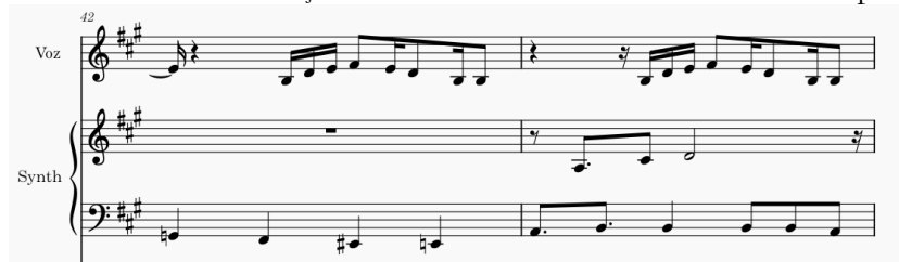
Figura 8 – Compassos 42 e 43: Finalização da letra e ciclo do baixo em dois compassos