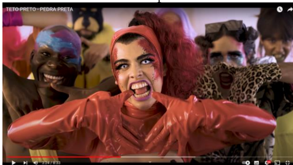
Figura 10 – PrintScreen do minuto 03:24 do videoclipe de Pedra Preta