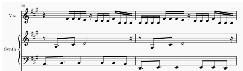
Figura 2 – Compassos 29 e 30: Ambos os acordes no caso do baixo oscilando entre Si e Mi