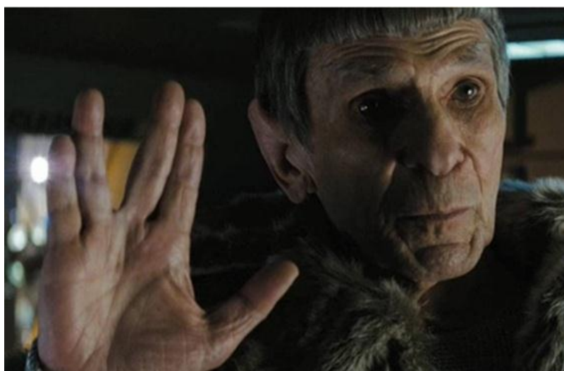
Foto do Filme Star Trek - Leonard Nimoy interpretando o Embaixador Spock.

A interligação online com todo esse ciberespaço existente foi a oportunidade que faltava para fortalecer esses fãs clubes, transformando-os na grande Comunidade Star Trek . Alia e interage, deslocando-se em uma nova dimensão, a qualquer hora possível, com pessoas distintas de diferentes lugares e culturas, tendo ou não oportunidades de agruparem-se no mundo off line . Há motivação, transformando assim, essas agregações em uma forma completamente inovadora para as relações humanas e, com certeza, em todas as organizações sociais.