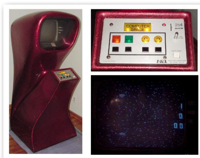
Figura 1 - Gabinete, controles e interface gráfica do jogo Computer Space

O jogo Spacewar! foi o primeiro registro de uma interface gráfica simbólica e chegou a ter uma versão comercial, operada por moedas, chamada Computer Space. Observando a figura 1, percebe-se que tanto a interface gráfica quanto os controles do Computer Space podiam ser demasiados intimidadores para a realidade dos anos 1970, como explicado por Luz (2010, p. 27): “Era uma mídia nova, num novo contexto e com uma interface também nova: muita novidade para uma mídia nascente como o vídeo game”.