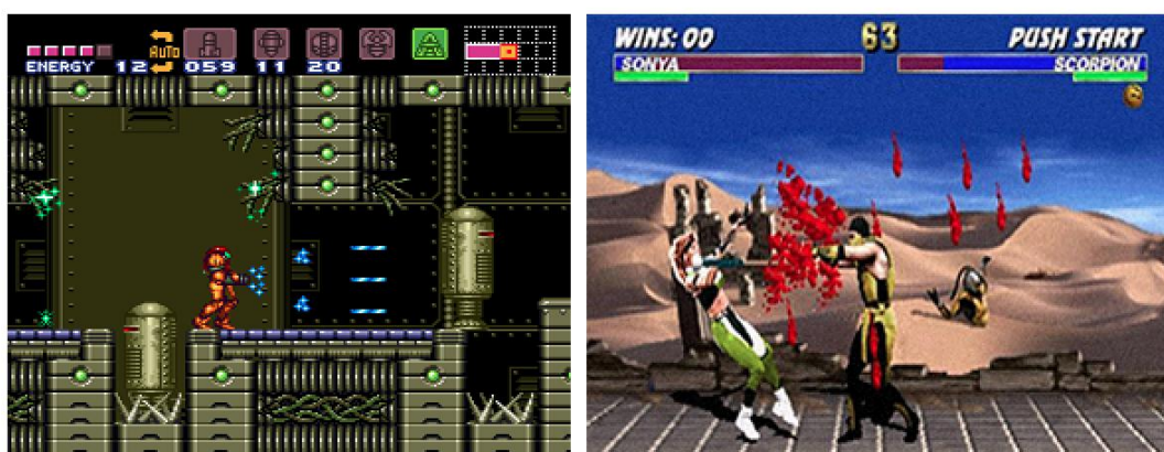
Figura 4 - HUD de Super Metroid mostrando energia, arma ativa e um pequeno mapa (esquerda) e HUD de Mortal Kombat 2 mostrando barra de energia, tempo e número de vitórias em sequência (direita)

Percebe-se ainda, nos exemplos da figura 3, um estabelecimento das primeiras versões de HUDs, como marcadores de pontuação, e também uma diferenciação mais evidente de gênero dos jogos como tiro, esporte e aventura.