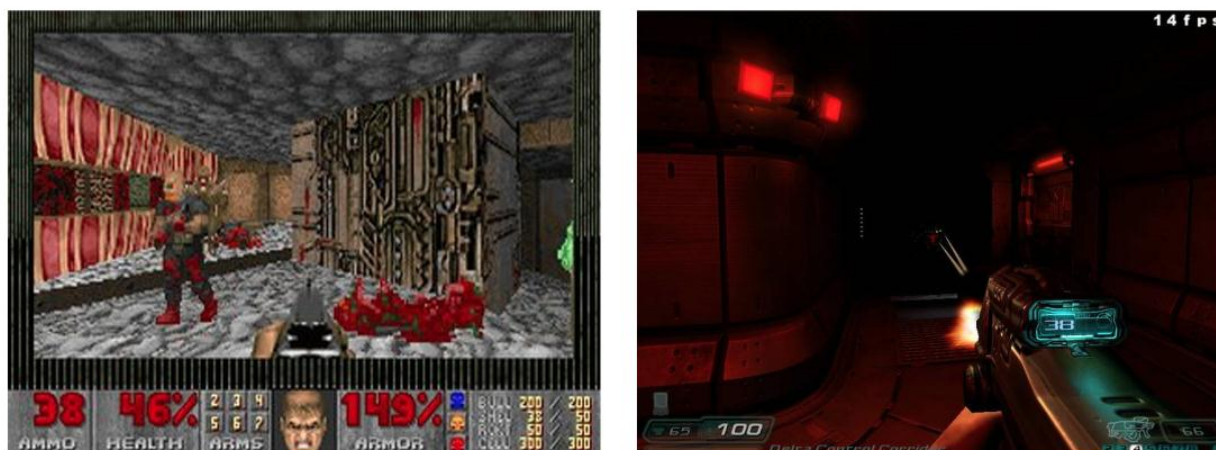
Figura 5 – À esquerda, Doom (1993 / idSoftware) com HUD espesso. À direita, Doom III (2002 / idSoftware) com HUD discreto e elementos de informação integrados ao jogo

Pela capacidade quase ilimitada de representação, Luz (2010) refere-se aos consoles atuais como “sintetizadores de realidade”. Livres de boa parte das limitações tecnológicas, o foco atual dos videogames é a imersão, definida por McMahan (2003 apud LUZ, 2010 p.75) como “a sensação artificial que um usuário tem num ambiente de que o ambiente não é mediado”. A jogabilidade, a interatividade, a linguagem visual e o enredo são apresentados de forma mais trabalhada, aproximando do cinema a narrativa e a experiência dos videogames . As interfaces gráficas, nesse contexto, vêm seguindo uma tendência de utilização de elementos mais discretos, com dimensões reduzidas, mais bem integrados, ou completamente incorporados ao conteúdo do videogame (figura 5).