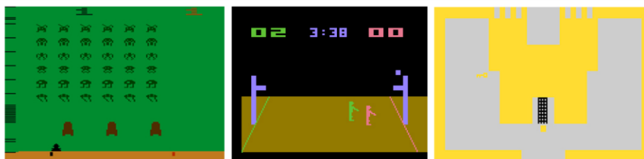
Figura 3 - Space Invaders (esquerda), Basketball (centro) e Adventure (direita)

Percebe-se ainda, nos exemplos da figura 3, um estabelecimento das primeiras versões de HUDs, como marcadores de pontuação, e também uma diferenciação mais evidente de gênero dos jogos como tiro, esporte e aventura.