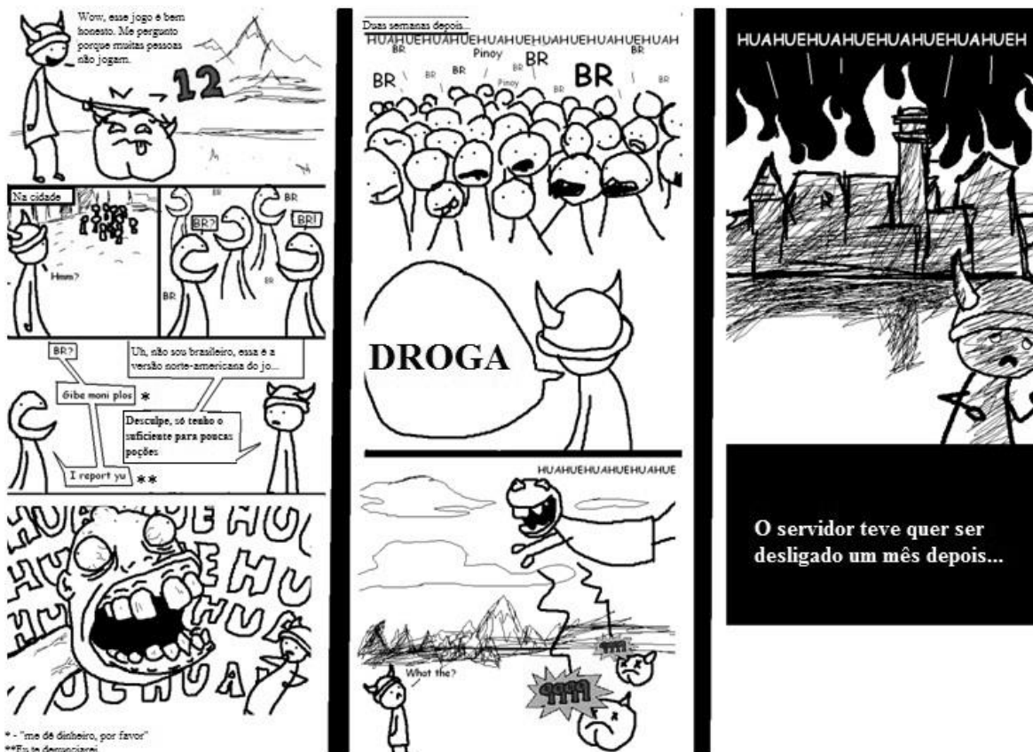
Figura 3 11

logo não há sentido em construir o brasileiro como um indivíduo negro 10 e desdentado. Observa-se assim o desejo se atingir a representação estereotípica original dos discursos não virtualizados, aquela que é exposta na fala de Roberto DaMatta.